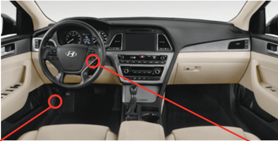
① Driver Kick Panel Panneau latéral côté conducteur